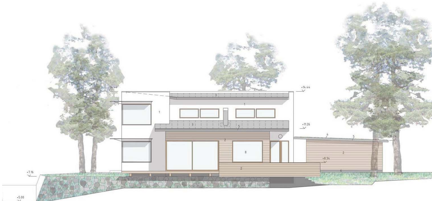
FASAD MOT HAVET, MOT NORR