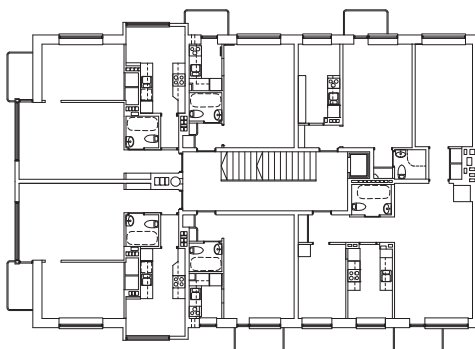
PLAN 2-4 TR

Leverantörer med produkter, textdokument.