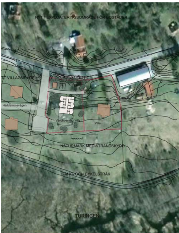
Flygfoto med illustration

Planområdet är till stora delar flackt och utgörs av tidigare odlad åkermark som legat i träda de senaste åren.