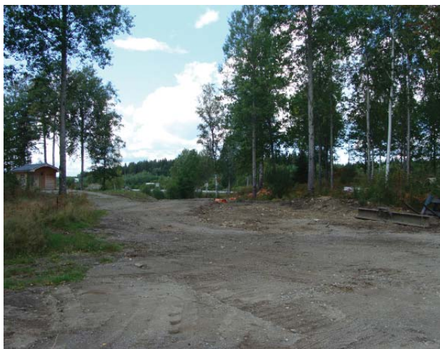
Plats för framtida industrihotell.

Gisselberg Arkitekter har tagit fram plankartan, planbeskrivningen och genomförandebeskrivningen i nära samarbete med beställaren och Nykvarns kommun.