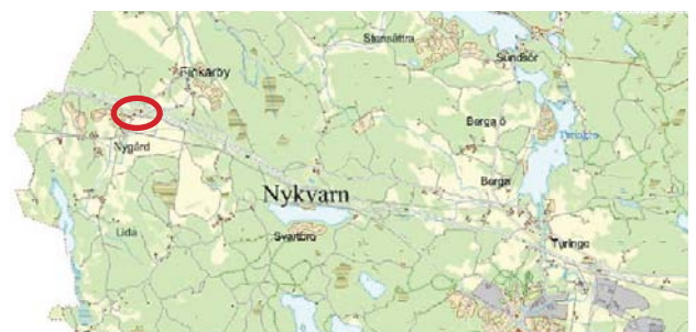
Orienteringskarta, detaljplaneområde ca 10 km väster om Nykvarns Centrum