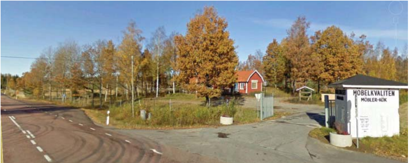
Planområdet sett från Gamla Strängnäs vägen.