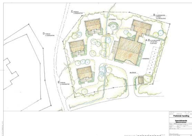
Underlag till detaljplan: situationsplan av Skyhill AB.