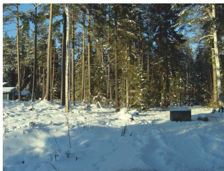
Den kommande bebyggelsen ska anpassas till skogsmiljön och allmänhetens tillgänglighet till naturområden försäkras.