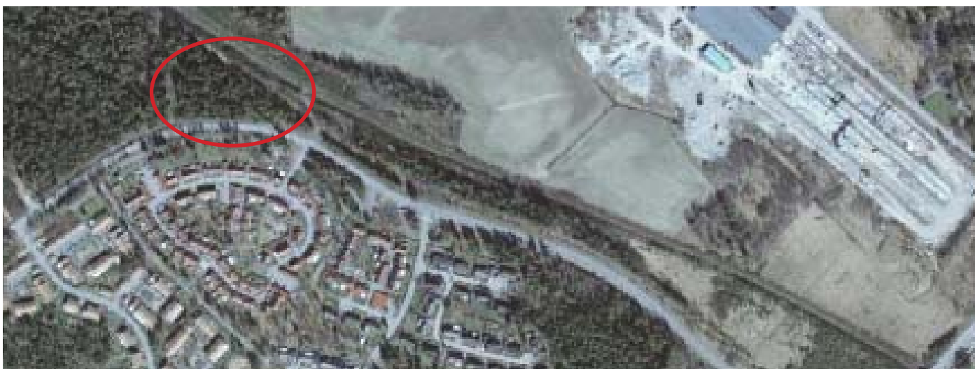
Planområdet är en del av större skogsområde som gränsar till Nykvarns tätort.