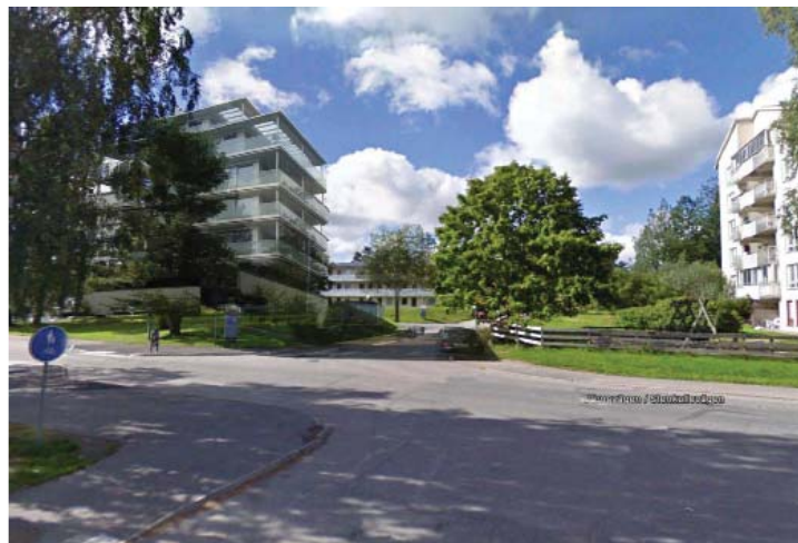
Illustration (fotomontage) som visar möjlig ny bebyggelse.