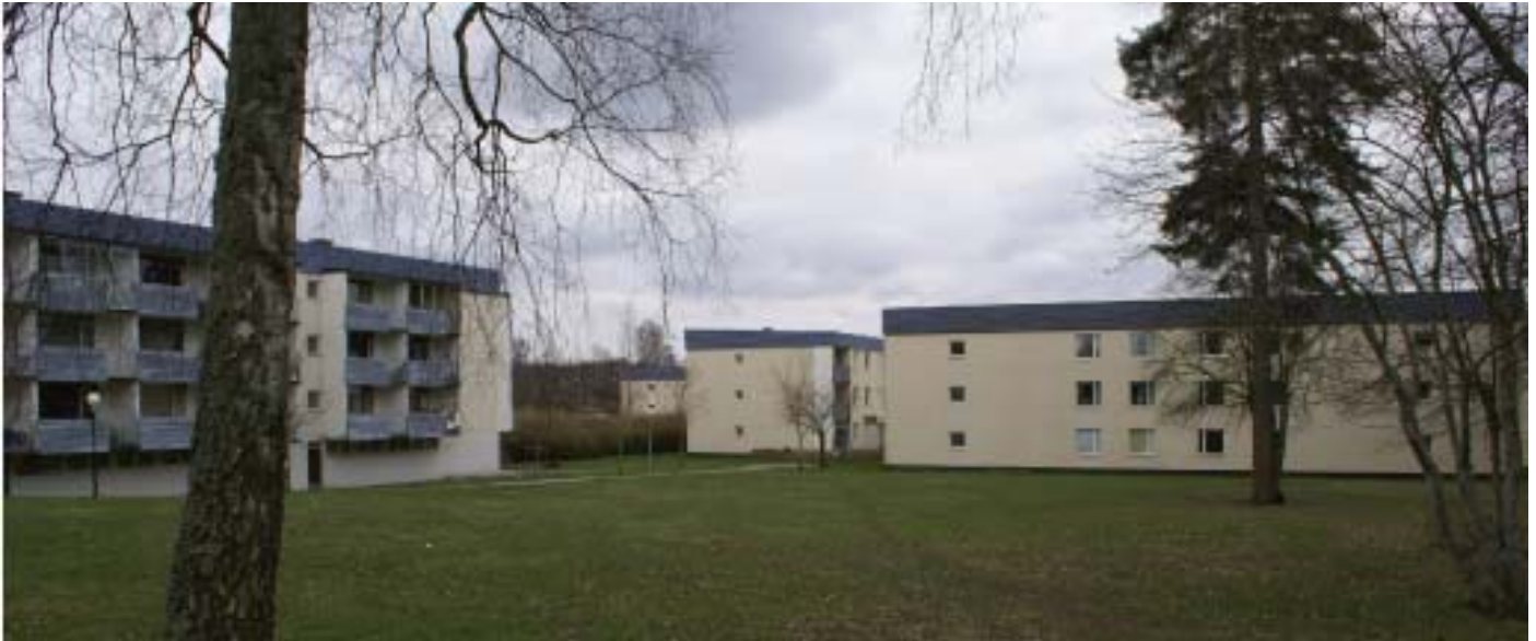
Kvarteret Karaffen är en enhetlig bostadskvarter med tidstypisk 60-tals bebyggelse.