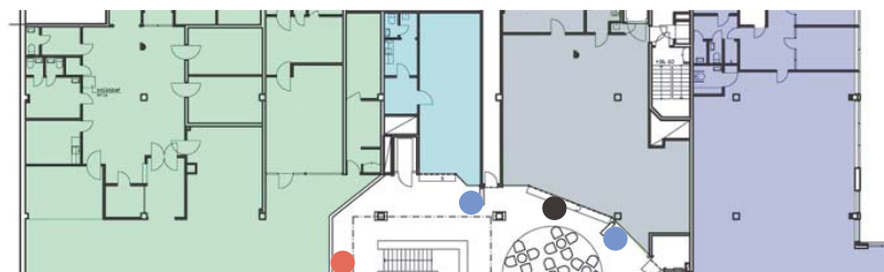
PRINCIP: ÖPPETTIDER ANNONSERING