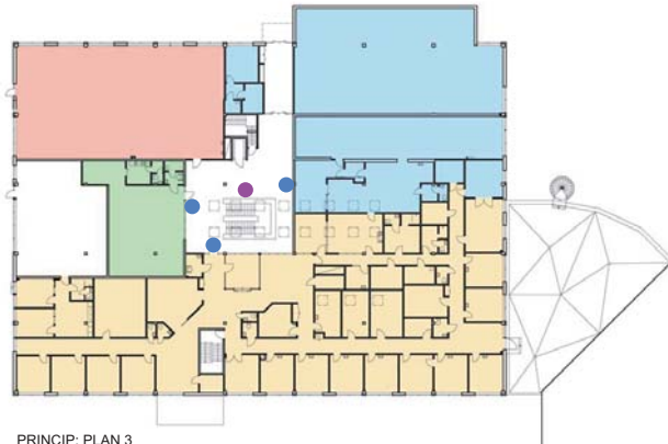
PRINCIP: PLAN 3