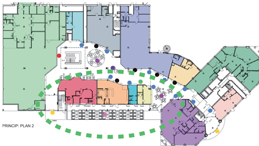
PRINCIP: PLAN 2