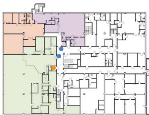
PRINCIP: PLAN 1